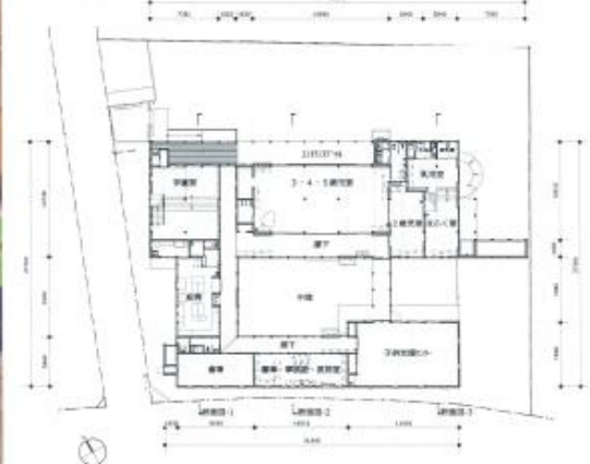
1階平面図・配置図 S=1:400

完成した新園舎で駆け回る子どもたちの笑顔、杉の床の上を愛おしくゴロゴロしている姿を見るにつけて、川上から川下まで協力して森の恵みを子どもたちに届けることが我々の使命であることを強く感じています。